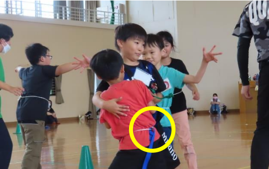
腰にぶら下げたヒモを取り合う「しっぽとりゲーム」。思わず大人も夢中でした。