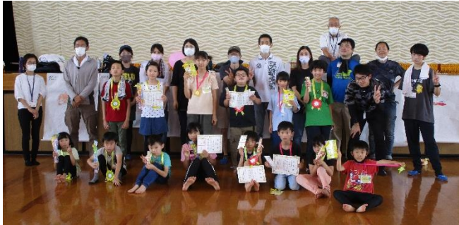
町内の小学生14人と保護者の皆さん、お手伝いしてくれた油木高校生徒の皆さん。