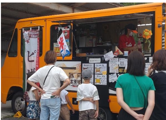
8月20日(土)さんわフリマ出店の様子。お客さんの長い行列ができていました。

土曜日はよく岩石農産物加工センターの横や、道の駅、三和協働支援センターの「さんわフリマ」などへ出店しています。以前、子どもが私のキッチンカーを指さして「あっ、おいしいクルマ！」と言ってくれたのが嬉しかった。子ども達が大きくなって、「昔、黄色い車のおもしろいおばちゃんいたな」と思い出したり訪ねて来てくれたらなあと思っています。これが私ができる地域への支援かな(笑)。