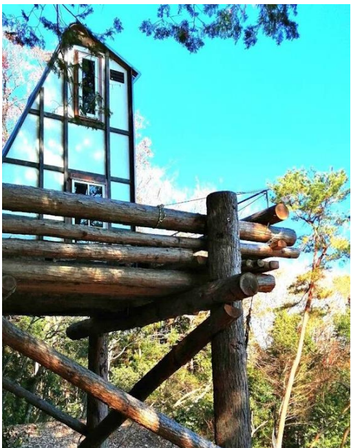
この自宅裏の展望台からはとよまつ紙ヒコーキタワー、油木の権現山、三和と神石を股にかける星居山などが一望できます。

「幻の鍾乳洞」を文献をもとにみんなで発掘しました。遊具もそうだけど、子ども達にいろいろな体験をさせたい。楽しかった思い出や、記憶を残せれば、いずれ神石に帰って来てくれるかもしれない子どもがいなくなれば、まちは消えてしまっからね。