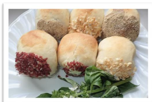
いろんな味のキューブ・クリームパン

思う「夏野菜のフォカッチャ」と、パンの中にいろいろな味のクリームが入っている、サイコロのように四角い「キューブ・クリームパン」を作りました。後藤先生のレシピには、お店ではあまり見かけない珍しいパンがあります。参加者の皆さんに「こんにちは」の挨拶を教える機会が減っています。最近、外出する機会が減っている、おうち時間」を過ごしていただきます。