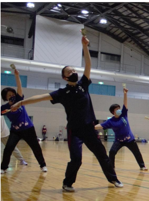
久しぶりの練習に汗を流す隊員の皆さん。

「やるしかない!」「がんばる!」「絶対成功!!」 やっばり大会出場! 観客の前で踊るのが楽しい! 大会や公演に向けて練習するの、目 と、力強い言葉を聞かせてもらいました。お姉さん達を手本に頑張る小学生、力強く華麗な舞の中高生、優雅な動きのベテラン隊員とカラーは様々ですが、上手になりたい、観客に披露したいという気持ちはひとつのようでした。緊急事態宣言下で十分な練習時間が取れないそうですが、それがさらにみ なさんを団結させているように感じました。11月28日の記念公演は、会場のさんわ総合センターやまなみ文化ホールで応援してください。入場は無料ですが、入場整理券は町内の各協働支援センターなどで配布しています。枚数に限りがありますので、観覧を希望される方は早めにお越しください。