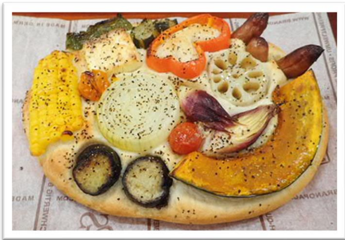
旬の野菜で彩られた夏野菜のフォカッチャ