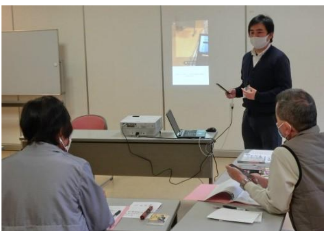
↑ 画面を映しながら一緒に学んでいきました。

「グループ通話」等の便利な機能を学びました。 後日、参加者の方から「子供達とグループトークを楽しんでいる。」「家族にスタンプを使ったら褒められた。」「といった嬉しい報告が耳に入りました。