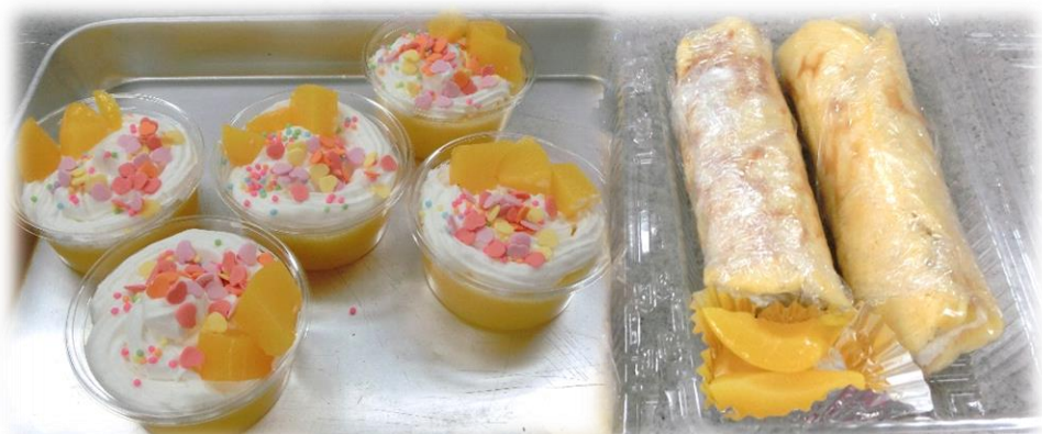
↑可愛く出来た簡単ぷるぷるオレンジゼリー。(左写真) ミニロールケーキの中には桃とバナナが入っています。(右写真)

最初に先生がお手本を見せ、残りの9枚の生地を見ながら協力をしながら焼きました。調理中の児童達から「生地を引っくり返す時に、1枚目より上達した。」という感想を聞くことが出来ました。