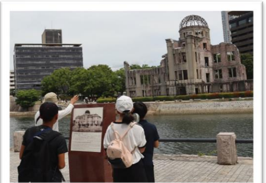
広島市ボランティアガイドの方に詳しく説明をもらい平和記念公園内を見学。

8月21日(水)折鶴献呈を開催しました。町内の小中学生、一般参加総勢36人で小学校や自治振興会など地域のみなさんに折っていただいた折鶴神石地区は4万1千羽を平和記念公園の原爆の子の像へ献呈しました。