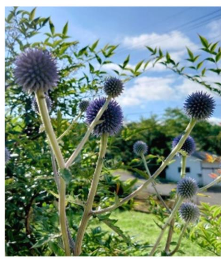
夏空に涼し気に揺れる薄紫のヒゴタイの写真が届きました。

地域の方からセンターで配布した小さなヒゴタイの苗が、花を咲かせた写真が届きました。町内の色々な所でヒゴタイが咲くのは素敵ですね。みなさんが撮影されたヒゴタイの写真を神石協働支援センター便り「ヒゴタイ写真館」に掲載します。メール、LINEでも受け付けていますので、ぜひ投稿して紙面を飾ってください。