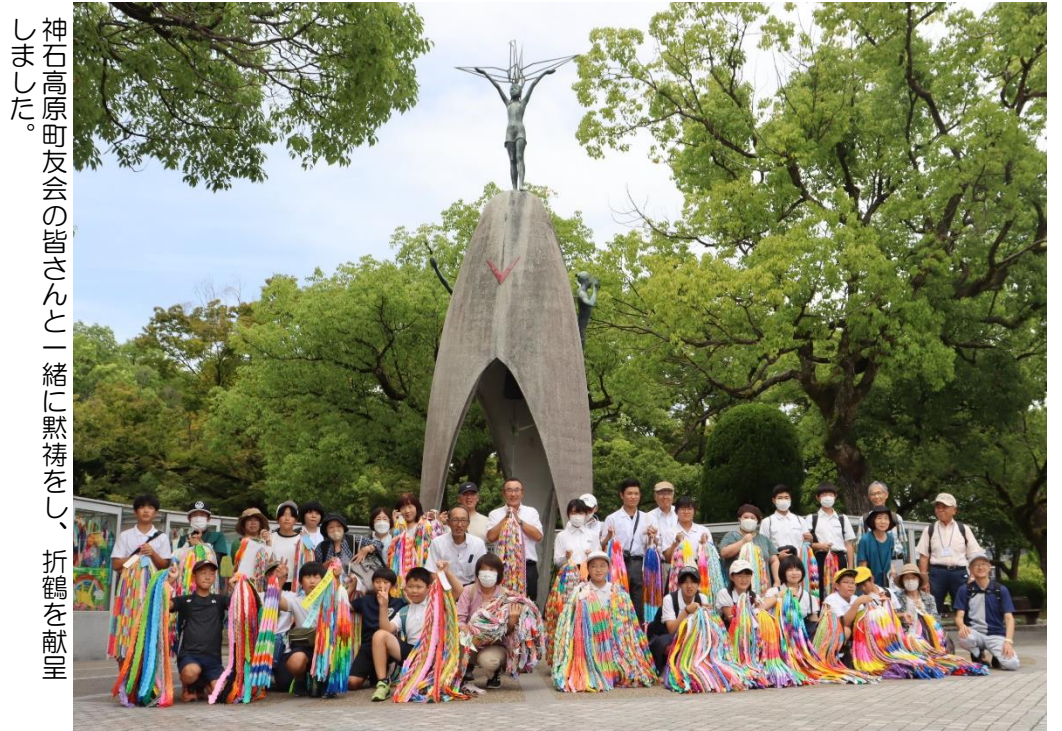
神石高原町友会の皆さんと一緒に黙祷をし、折鶴を献呈しました。