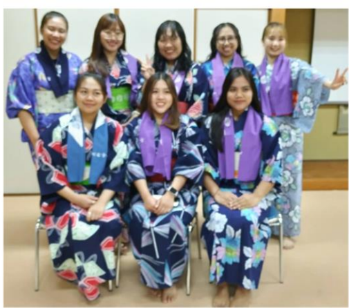
地域の方に浴衣の着付けをしてもらった実習生のみなさん。

8月14日(水)福永地域で納涼盆踊り大会がありました。神寿苑の技能実習生も浴衣姿で参加され1期生3人は帰国直前でしたが最後に盆踊り大会で地域の方と別れを惜しみながら交流しました。