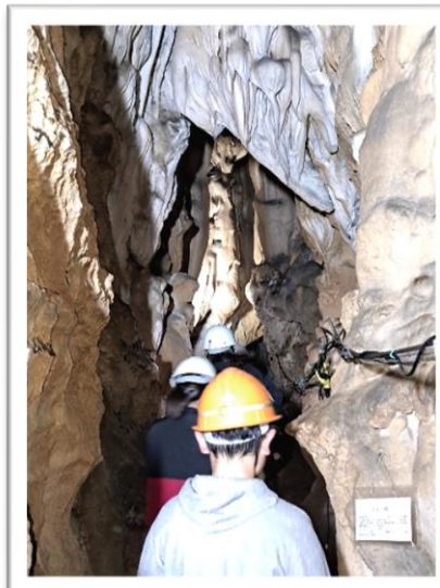
実際に幻の鍾乳洞に入ると貴重な鍾乳石が間近で見ることが出来ます。

ながの村自治振興会では花面公園の東屋に幻の鍾乳洞案内看板を設置しました。写真を多く取り入れて幻の鍾乳洞について説明されています。花面公園にお越しの際には、看板をご覧ください。