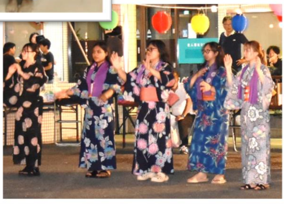
着付け後は浴衣姿で地域の方と一緒に踊りました。

8月14日(水)福永地域で納涼盆踊り大会がありました。神寿苑の技能実習生も浴衣姿で参加され1期生3人は帰国直前でしたが最後に盆踊り大会で地域の方と別れを惜しみながら交流しました。