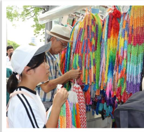
神石小学校児童も参加し、折鶴を献呈しました。

8月21日(水)折鶴献呈を開催しました。町内の小中学生、一般参加総勢36人で小学校や自治振興会など地域のみなさんに折っていただいた折鶴神石地区は4万1千羽を平和記念公園の原爆の子の像へ献呈しました。