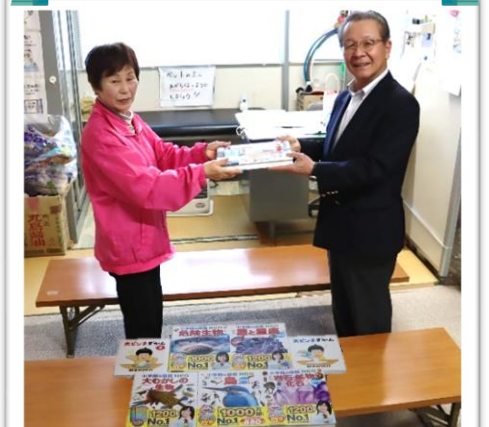
DVD付き図鑑は子ども達に大人気だそうです。今回新しいシリーズの図鑑を寄贈しました。