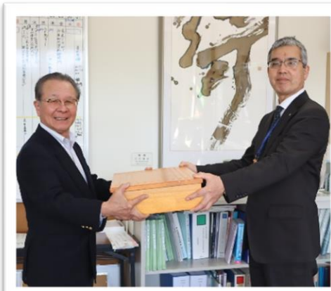
授業で背が低い低学年の児童が黒板に文字が書きやすいように踏み台8台を寄贈しました。