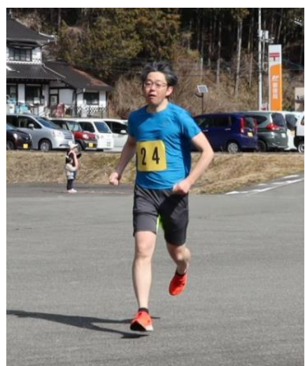
雪どけマラソンに出場され、初参加で2位でした。来年こそ優勝を！

実際に住んでみて、地域の方は優しく、生活面の事など地域の様子を教えてくださいました。みなさんが「今年は雪が少ない」と言われていました。が、私には今年の雪でも大変に感じました。