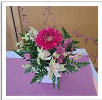
6年生の作品。自分の好きな色を取り入れて生けました。

3月の生け花教室で卒業する6年生が一年の集大成の作品を生けました。卒業式の日小学校で展示してもらい、先生や来賓、保護者のみなさんなど多くの人に見ていただきました。とても頼りになる6年生でした。中学校生活も元氣よく楽しんでくださいね。頑張ってください！