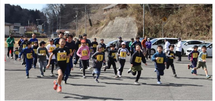
保育所や小中学校の子どもと大人総勢37人が元気にスタート!!