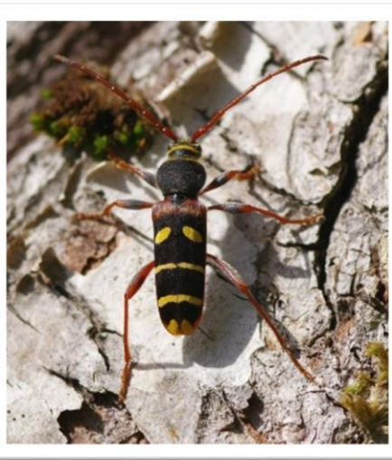
ハチと見間違えるほど似ているクリストフコトラカミキリの話です。

私は虫屋です。虫を売っているわけではありませぬ。虫が好きで、集めたり、研究している人々を「虫屋」と呼んでいます。虫屋は、「チョウ屋」「トンボ屋」「甲虫屋」など細分する場合があります。私は「甲虫屋」ですが以前トンボ屋だったこともあり、トンボもカミキリとしてはハチ ともあり、トンボもわかりやすい。チョウもあ程度わかりやすいが、蛾やバッタはさっぱりです。そんな虫屋から見た身の回りの自然を紹介します。 今回は枯木や薪に集まる「クリストフコトラカミキリ」です。虎模様のあるカミキリの仲間で、ハチに擬態しているものが多く、クリストフコトラカミキリも、触角を細かく震わせながら木の上を歩き回るので、ちょっと見にはハチに見えるかもしれません。が、トラカミキリとしてはハチ への似せ方は下手な方でしょう。最初に見つけたのは、貯木場でした。黒と黄色の取り合わせが綺麗で、カッコイイと思ったものです。春から初夏くらいまで、コナラなどドングリの木の倒木や伐採木があればたくさん個体を見ることが出来るかもしれませぬ。名前に「コ」と付いていますが、体長15ミリ前後でトラカミキリとしては中型です。一番大きいのはオオトラカミキリですが、広島県ではまだ見つかっていません。参考までに言うと、オ