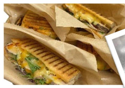
ピタパン ケーキも作りました