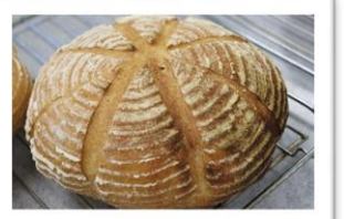
パン・ド・カンパーニュ

4月～12月の毎月1回開催し、毎回2種類のパンを作りました。参加者からいちばんよく言われるのが「家族もパン教室のパンを楽しみにしている」です。みんなで作って楽しみ、家族と食べて楽しむ事ができた手作りパン教室でした。