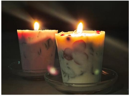
完成したアロマキャンドルを灯してみました。

初登場のアロマキャンドル教室です。見たことあるけど、実際どう作るのか興味津々なところから始めました。ドライフラワーやアロマオイル、キャンドルの色を自分で選んで作りました。