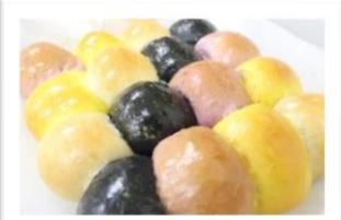
ハロウィンちぎりパン